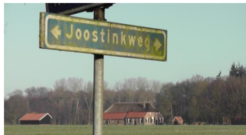
Het Joostink in 2015